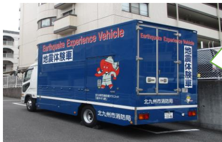
「震度6～7を体験しまし