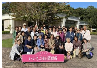
「かえる寺といいちこ日田蒸留所」への旅。「おいしい焼酎 買いました!」