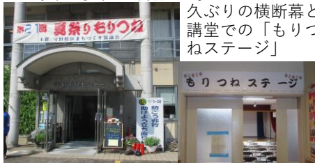
久ぶりの横断幕と講堂での「もりつねステージ」