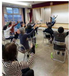
「笑顔で、はーい、元気よ」