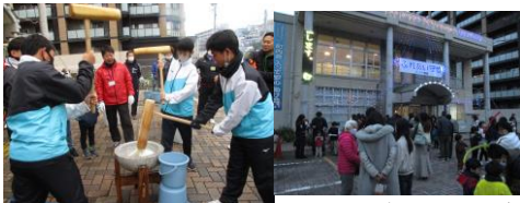
今年は、守中テニス部のイルミネーション点灯式に沢山の人が!