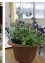
うぐいすの会コーラス↑ 寄せ植え講座