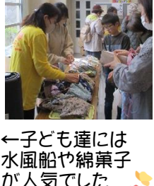
←子ども達には水風船や綿菓子 が人気でした