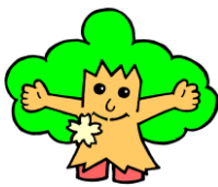
守恒校区キャラクター もねとくん