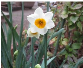
森津根ガーデンのスイセン