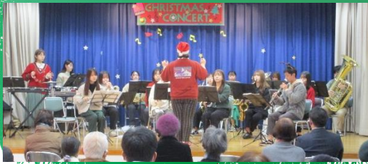
守恒小学校家庭教育学級 守恒校区健康づくり事業 共催